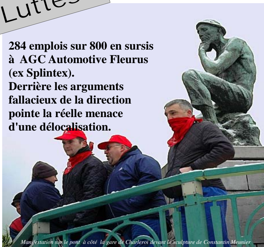
Manifestation sur le pont à côté la gare de Charleroi devant la sculpture de Constantin Meunier

284 emplois sur 800 en sursis à AGC Automotive Fleurus (ex Splintex). Derrière les arguments fallacieux de la direction pointe la réelle menace d'une délocalisation.