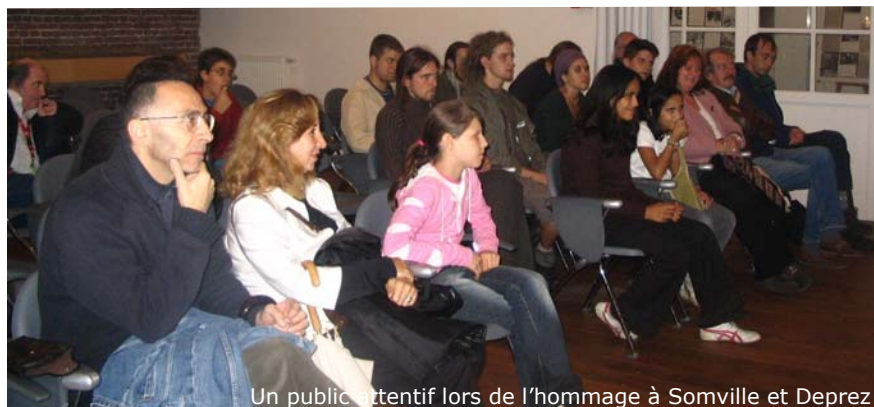
Un public attentif lors de l'hommage à Somville et Deprez