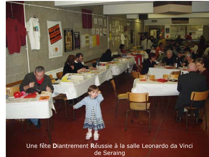
Une fête Diantrement Réussie à la salle Leonardo da Vinci de Seraing

Certains disent « que faire ? », à la fédération liégeoise du PC, nous disons : « que dire... », tant la fête qui s'est déroulée ce 5 novembre dans la salle Leonardo Da Vinci de Seraing fut une réussite. En effet, nous avons eu droit à une après-midi politique qui s'est déroulée comme sur du velours – rouge, un repas beaucoup trop copieux – il en reste toujours... et une soirée courte mais de qualité.