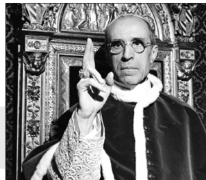
Eugenio Pacelli, le Pape Pie XII, en 1945.

C'est donc ce personnage trouble que Ratzinger, ancien des jeunesses hitlériennes, s'apprête à béatifier. Un vrai bain de jouvence, serait-on tenté de conclure.