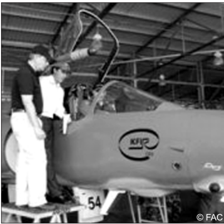
Un sénateur nord-américain évalue les capacités opérationnelles à la base de Palanquero (12/08/09).

Les frictions récurrentes entre Caracas et Bogota se sont accentuées depuis la signature de l'accord qui permet aux États-Unis d'utiliser sept bases militaires en territoire colombien. Ces dernières semaines, les accusations d'espionnage et les meurtres attribués au paramilitarisme se sont multipliés dans les zones frontalières.