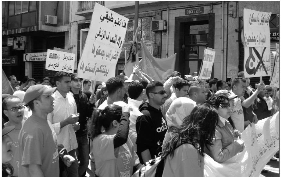
Défilé du 1 er Mai 2009 à Tanger ▲►

Le PCS était l'un des piliers de cette idéologie qui animait la ferveur des masses arabes, leur soif de libération, de changement et de progrès. Il a été la principale force politique et populaire qui a fait tomber le premier dictateur militaire du Soudan, le maréchal Ibrahim Abboud en 1964. Fondé en 1946, certaines statistiques le créditaient, lors de son congrès de 1967, de plusieurs centaines de milliers de membres. Sa puissance était, en tout cas, indiscutable. Sa confrontation ouverte dans les années