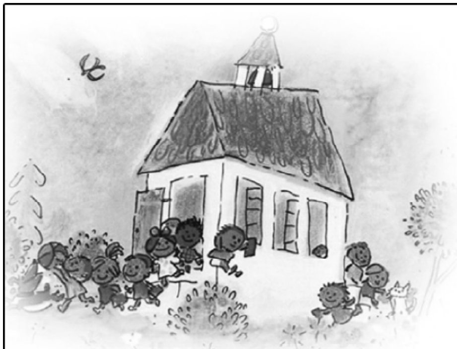
« Illusion? » de Frederic Back

Par le fait même que leur formulation est extrêmement vague, les compétences permettent de ramener les objectifs de l'enseignement obligatoire à ce qui doit constituer le bagage commun de personnes aux destins professionnels aussi différents qu'un ingénieur et un vendeur de hamburgers. La forme ultime de ce « plus petit commun dénominateur », ce sont les compétences de base que s'attache