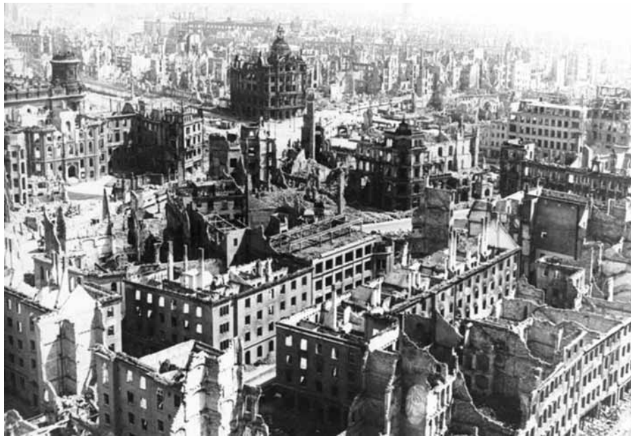
Dresden 1945: Blick vom Rathausturm auf die zerstörte Stadt. Im Vordergrund der heutige Pirnaische Platz

Il y a de nombreux monuments qui valent le détour à Dresde. La ville est un joyau architectural mais il faut aussi savoir s'égarer et aller à la recherche de l'inattendu. Comme au Deutsches Hygiene-Museum de Dresde qui n'est pas a priori le lieu où l'on s'attend à trouver une exposition sur le travail, encore qu'il se veuille un musée de l'homme. La notion de travail n'est pas facile à cerner, surtout si l'on considère qu'elle contient mais ne recouvre pas entièrement celle d'emploi. Définissant par hypothèse le travail comme une