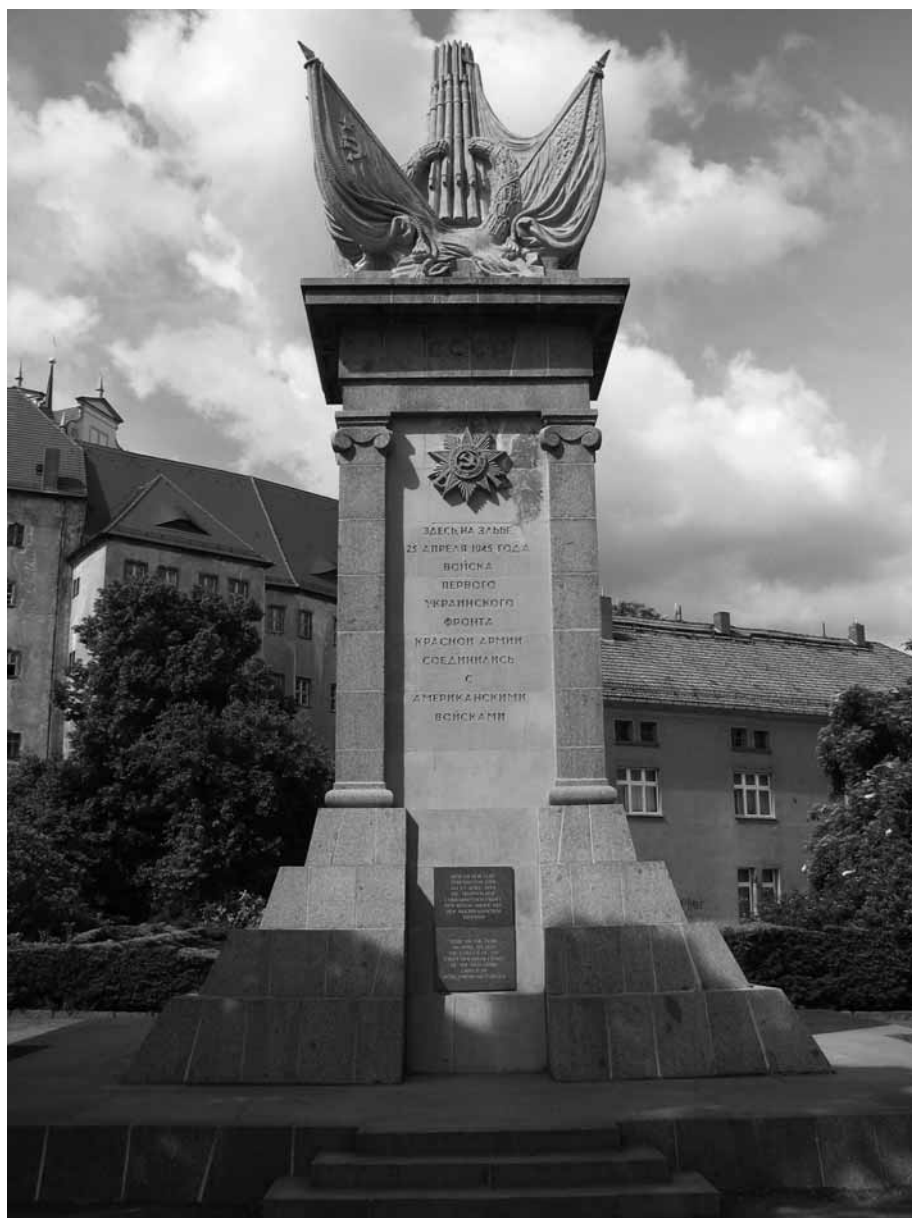
Torgau. Monument commémorant la jonction de forces alliées

Puis il remarque les drapeaux palestiniens accrochés à nos vélos et la conversation s'emballe. « Nous mettons cette maison en vente car nous ne voulons plus demeurer dans cette Allemagne », nous confie Gerhard et de poursuivre avec des mots très durs « Je comprends que vous vous luttiez pour le droit des Palestiniens. Les États-Unis d'Amérique et l'État d'Israël sont les grands gendarmes du monde... et Angela Merkel, après avoir