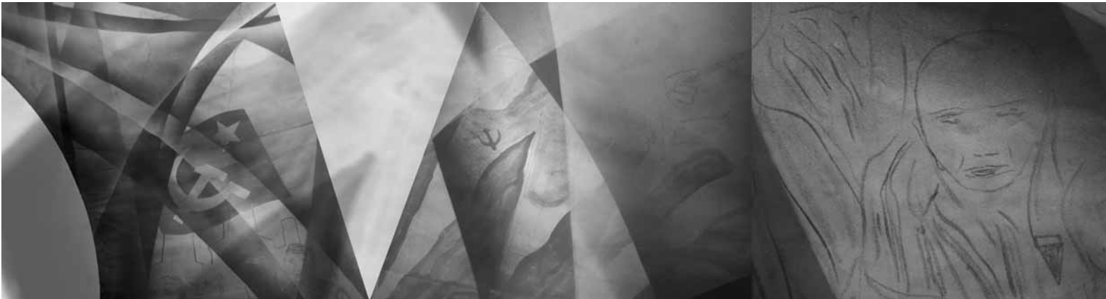
Le Mémorial Italien, détails de la spirale peinte par Samonà illustrant la faucille et le marteau, les drapeaux communistes ainsi qu'un déporté politique.

Le Mémorial italien en l'honneur des victimes italiennes du camp d'Auschwitz-Birkenau, construit grâce à des contributions des mouvements de gauche et syndicats, fut inauguré en 1980 dans le Bloc 21 de ce même camp. Il fut conçu par l'ANED 1 et développé par l'écrivain juif italien Primo Levi, les architectes BBPR 2 , le peintre Pupino Samonà en collaboration avec le musicien Luigi Nono et le cinéaste Nelo Risi.