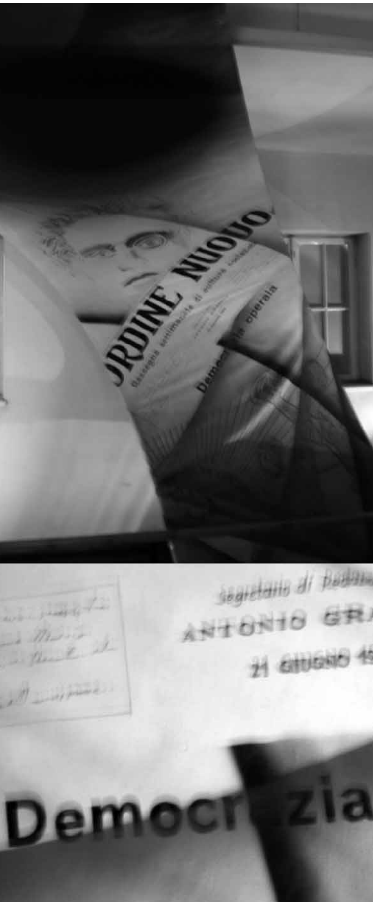
Le Mémorial Italien, devant la fenêtre fermées par la direction d'Auschwitz, l'évocation, sur la spirale peinte par Samonà, de Antonio Gramsci, emprisonné par le fascisme.

XXI » 4 . Le projet consiste en une série de « lignes de fuite », des rubans en fonte qui accompagneront la spirale, obtenus par la fusion à haute température de centaines de rails de train. Ces « rubans » en fer seront disposés derrière les spirales, les protégeant comme dans un embrassement symbolique. Sur ces faisceaux ferreux seront gravés des faits et données historiques mais aussi des écrits, poésies et autres textes liés à la déportation en italien, polonais, hébreux, romani et autres langues, gravés sur le fer contre tout abandon et oubli futur. Le défi est de rendre possible la survie de ce Mémorial dans son intégrité et d'assurer la continuité de son contenu moral enrichi avec l'histoire de la déportation des Roms et slaves italiens, des homosexuels, des handicapés des Témoins de Jéhovah etc. Évidemment, rien n'est plus éloigné de ce que veulent les détracteurs du Mémorial qui luttent pour une mémoire de l'histoire de la déportation aplatie, qui ne parle que de la Shoah, créant des conflits de mémoire là où la mémoire devrait être un lieu de compréhension grâce à une vision d'ensemble du passé. Ne sélectionnant « que » une partie des mémoires, cette mémoire ne rendra