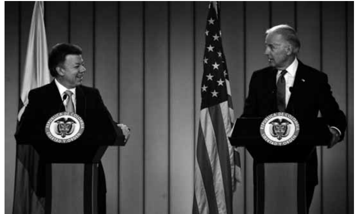
À gauche, Juan Manuel Santos, et Joe Biden.

Ayant envie de s'aérer, Juan Manuel Santos s'en est allé ensuite rendre visite, du 9