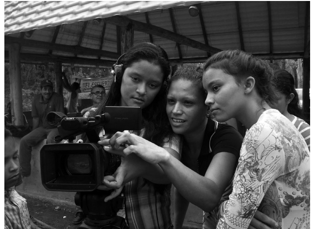
Terra TV : les paysan.ne.s du Venezuela définissent les contenus et se forment pour les réaliser https://wp.me/p2ahpz-4hl

Solas à Cuba. Ce qui est très intéressant chez les soviétiques des années 20, c'est qu'ils pensent les nouvelles images non seulement depuis le contenu mais