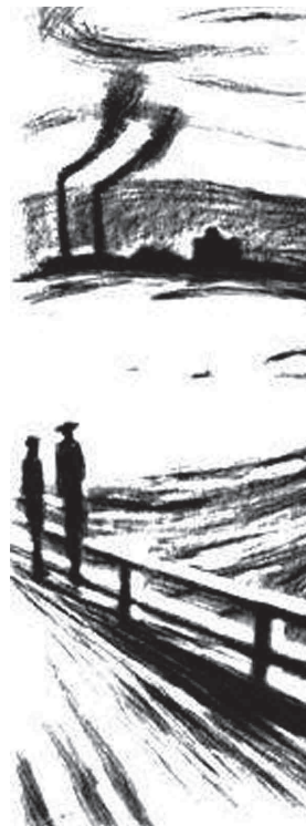
Inspiré du tableau d

Une étude, parue dans Le Monde du 12 septembre 2018, fait état d'un rapport émanant de l'Organisation des Nations Unies pour l'Alimentation et l'Agriculture (FAO) qui pointe l'effet sur la sous-nutrition mondiale des dérèglements climatiques provoqués par la hausse mondiale des températures, elle-même due à