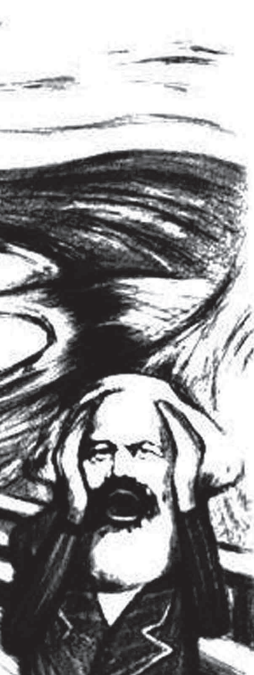
Edward Munch "Le cri"

Aujourd'hui, syndicats, jeunes manifestants pour le climat -en dépit de la triste comédie de la Loi Climat-, agriculteurs défenseurs d'une agriculture à taille et finalité humaine, gilets jaunes pour le pouvoir d'achat comprennent la cohérence entre les luttes sociales et pour la protection de l'environnement. Ils joignent leurs voix pour mettre fin à la toute-puissance d'un modèle de développement capitaliste mercantile, sourd aux besoins humains et finalement auto-destructeur. ■