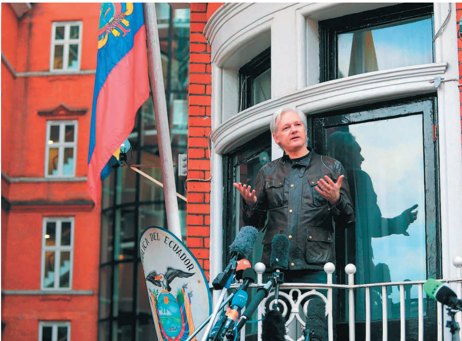
Assange : le courage et la dignité